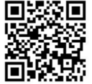
報名網站 QR CODE