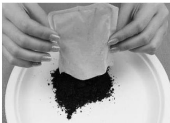
圖 1 市售暖暖包

市售暖暖包(如下圖 1 所示)中常加入蛭石,其功用為跟空氣接觸後,能快速地吸收空氣中水分,加速鐵粉的氧化速率,進而放熱達成暖暖包的效果。 小育 想要以咖啡渣(如下圖 2 所示)來取代暖暖包內容物—蛭石,以期減少廢棄量。因此進行以下兩組實驗: